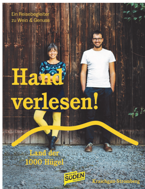
Abb. 1: Der Titel des neuen Mag Handverlesen! des Kraichgau-Stromberg Tourismus e.V.