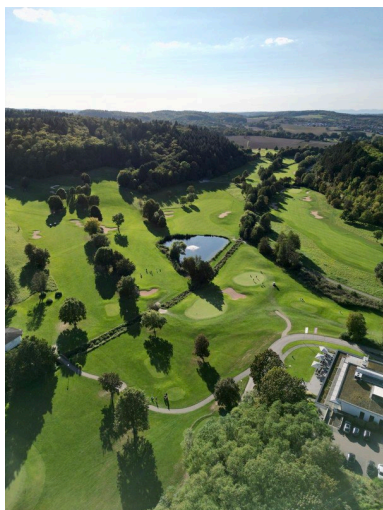
Abb. 5: Golf im Land der 1000 Hügel: In den Heitlinger Genusswelten kommen Wein- und Golfliebhaber gleichermaßen auf ihre Kosten.